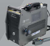
Bomba de Tensionado