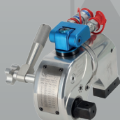
Llave de Torque Hidráulica con cuadrante