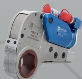
Llave de Torque Hidráulica Hexagonal