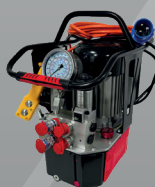
Bomba de Torque Hidráulica