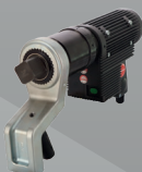
Llave de Torque Controlado Eléctrica