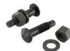
*Pernos TC A325 y A490