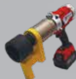
Llave de Torque Controlado a Bateria