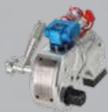
Llave de Torque Hidraulica con cuadrante