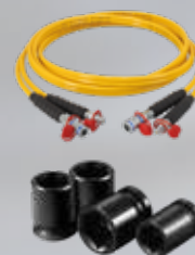
Mangueras de Torque y Dados de Impacto