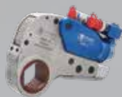
Llave de Torque Hidraulica Hexagonal