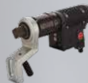
Llave de Torque Controlado Electrica